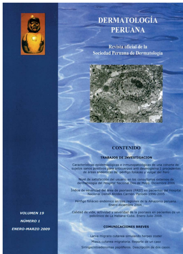
Figura 7. Nuevo formato de la carátura de la revista que inicia con el volumen N° 19.