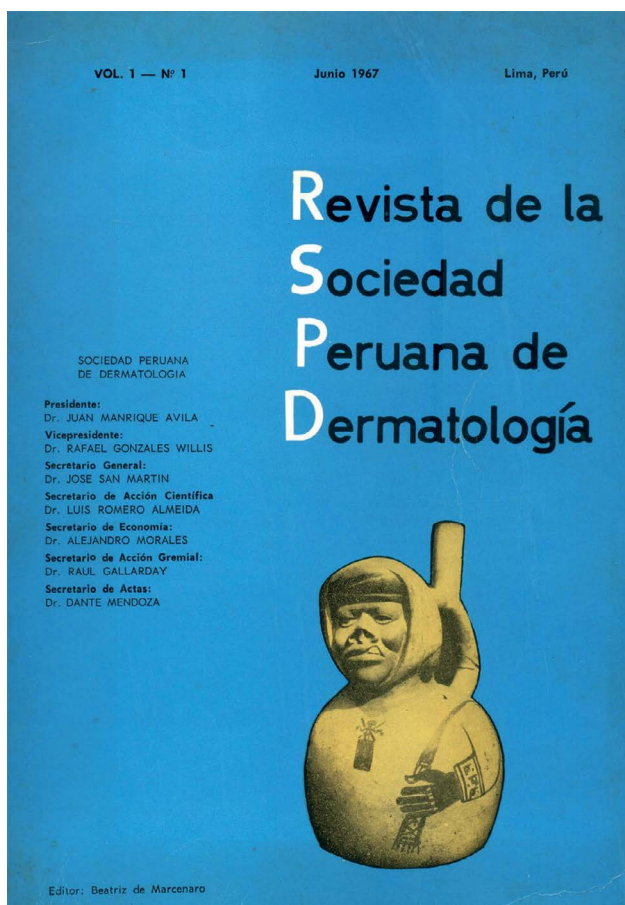
Figura 1. Carátula del histórico primer número.

Este ese tiempo la revista se publica con una periodicidad semestral. Además edita suplementos tales como: Infección VIH-SIDA en el Volumen 8, Suplemento 1 de Diciembre de 1998; Biología Molecular en el volumen 9 Suplemento 1. Diciembre 1999 y Infecciones de transmisión sexual en el volumen 10 Suplemento 1, de Diciembre del 2000.