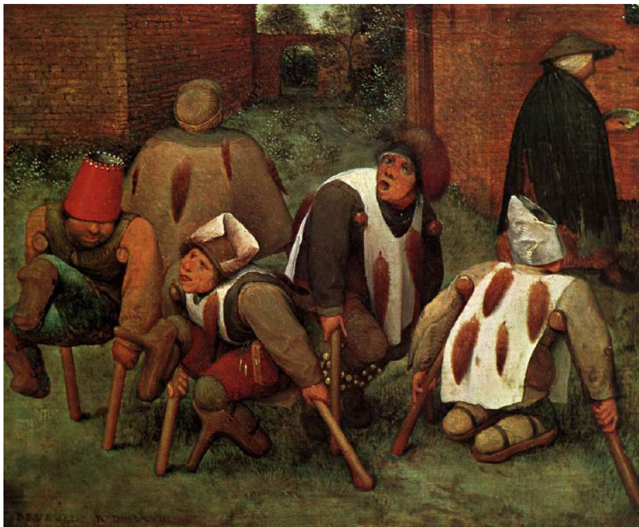
Figura N° 6. Los mendigos o los lisiados. Pintura al óleo sobre tabla.

de la civilización occidental comprendido entre el siglo V y el XV. Su inicio se sitúa en el año 476, el año de la caída del Imperio romano de Occidente, y su final en 1492, año en el que Colón llegó a América), la consideró resultado de un castigo Divino y condenó al leproso, en tanto pecador, a la reclusión o al aislamiento. La condena, sucedía al diagnóstico, y comenzaba con su entierro simbólico en el seno de la iglesia. Acabada la lúgubre ceremonia, el propio sacerdote, acompañaba al muerto en vida, hasta las puertas de la ciudad 8 . El leproso, se convertía entonces, en un marginado, condenado a vivir en la indigencia, al otro lado de los muros que contenía al resto de la población. Este era el precio que debía pagar por su pecado, único camino hacia la salvación.