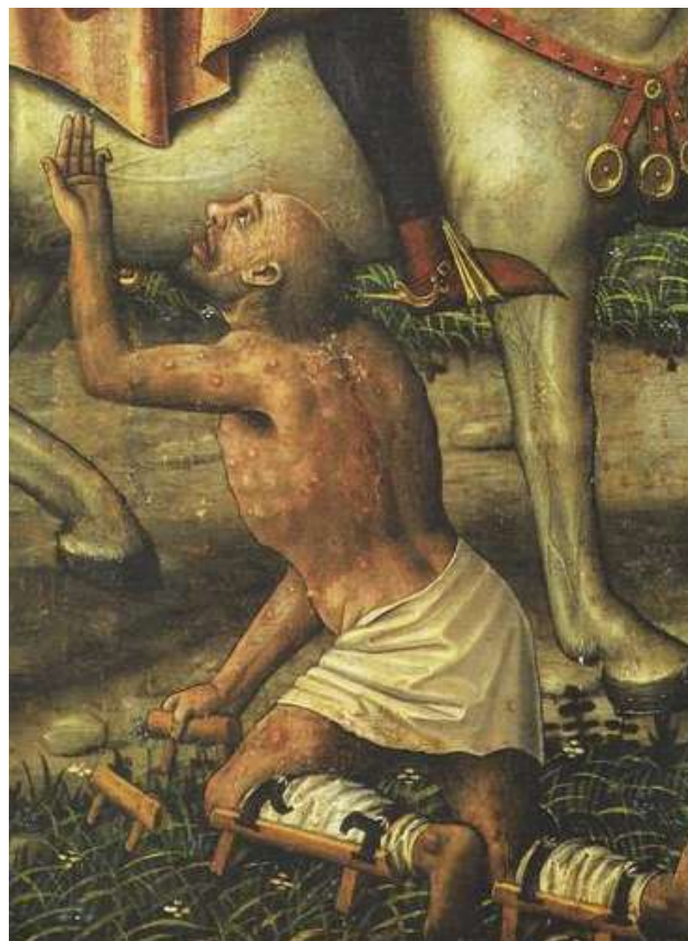
Figura N° 5 B. Detalle del mendigo que presenta lesiones de lepra.