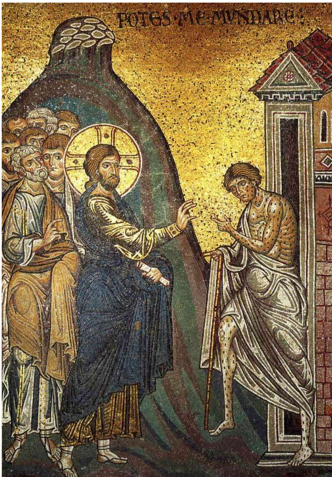
Figura N° 1. Jesús cura al leproso. Lugar: Mosaicos de la Catedral de Monreale (Sicilia).