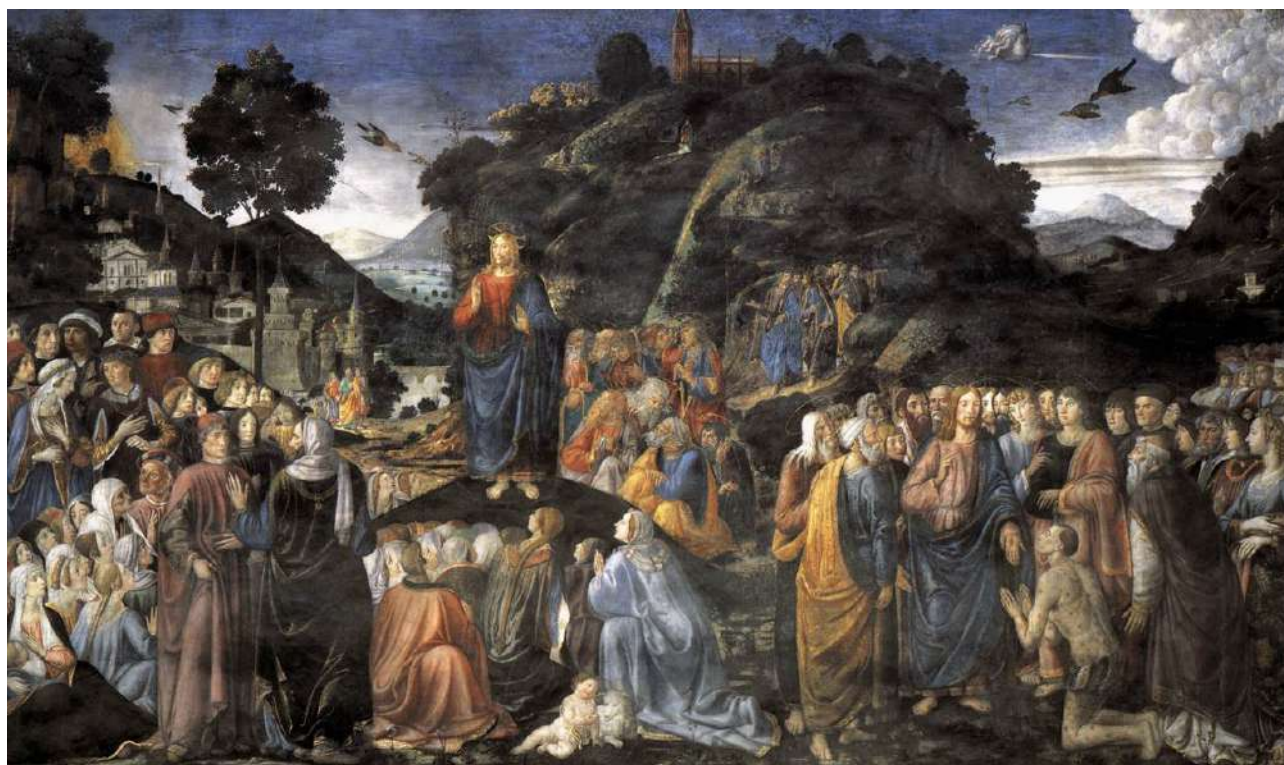
Figura N° 2. Sermón de la montaña y la curación del leproso. Pintor Cosimo Rosselli.

Fresco de 349 x 570 cm. Realizado entre 1481 y 1482.