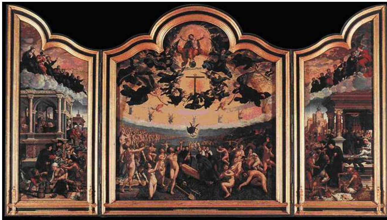
Figura N° 3 A. Tríptico sobre el juicio final. Bernaert Van Orley. Escuela Flamenca. Real Museo de Bellas Artes de Amberes. Características: Óleo sobre tabla 248 x 218 cm. (Tabla central) y 248 x 94 cm (puertas laterales).