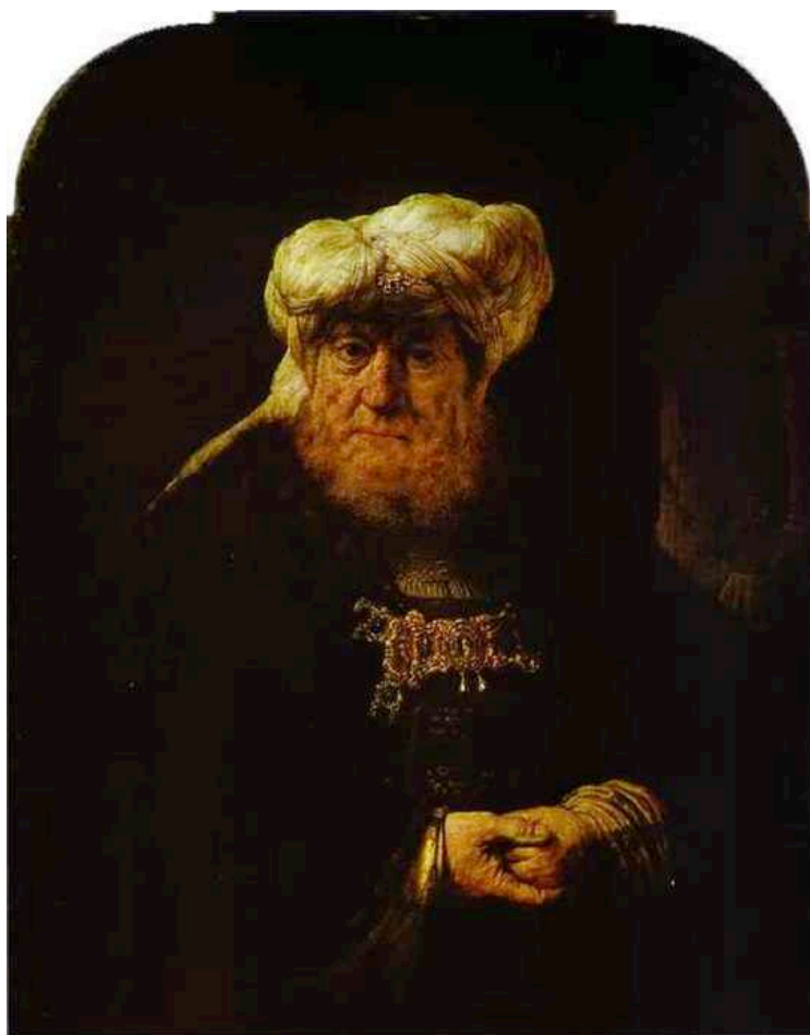
Figura N° 4. El Rey Uzías, Herido por la lepra (1639). Óleo sobre lienzo Pintor: Rembrandt Van Rijn