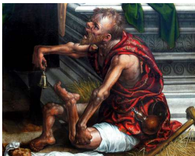
Figura N° 3 B. Pintura que representa a un leproso: De Tríptico sobre el juicio final. Real Museo de Bellas Artes de Amberes.