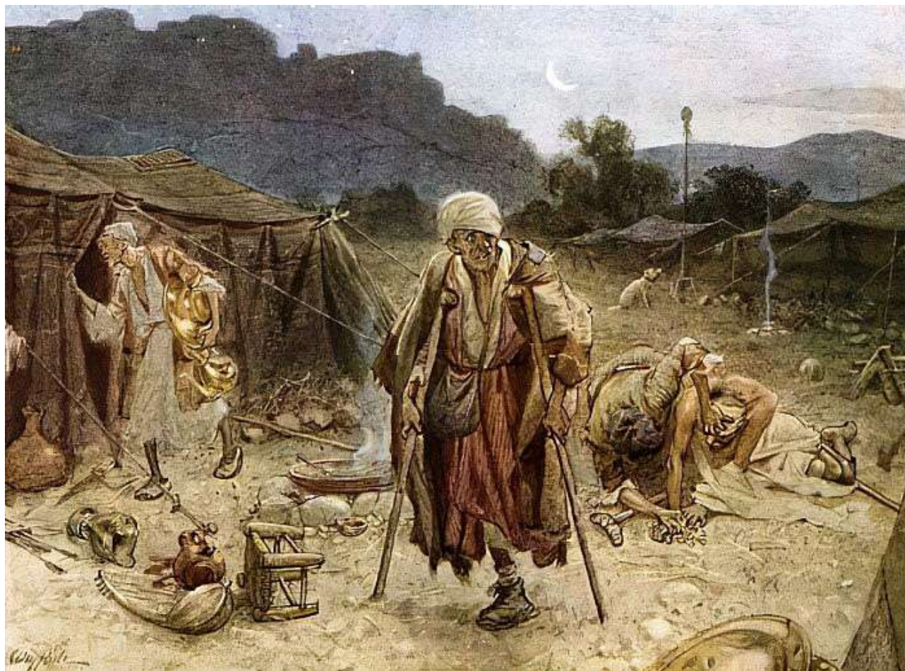
Figura N° 7. Los cuatro leprosos saqueando el campamento de los Sirios.

Autor: William Brassey Hole. Pintor y gravador inglés.