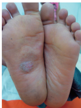
Figura 1: Placa verrucosa