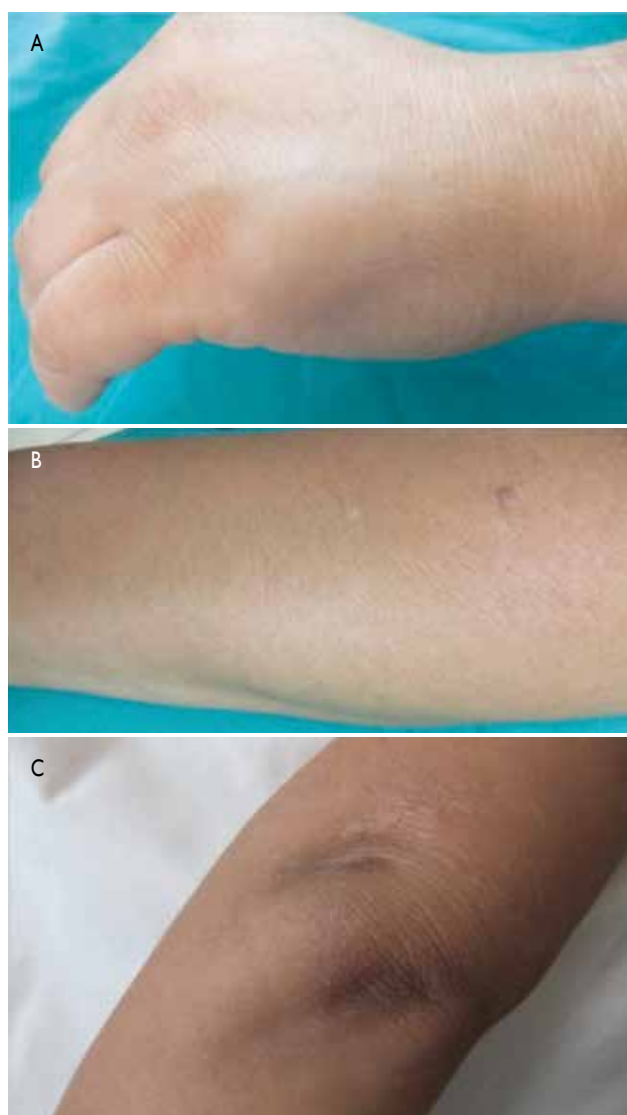
Figura 1. A) Lesión nodular en el dorso de la mano izquierda. B) Nódulo en antebrazo izquierdo. C) Nódulo en codo izquierdo.

Mujer de 44 años, natural y procedente de Lima, con diabetes mellitus tipo 2 e hipotiroidismo controlados, que refería aparición hacía cuatro meses de ‘bultos’ no dolorosos, el primero de ellos en dorso de mano derecha y luego progresivamente en otras localizaciones de las extremidades, negaba otros síntomas generales. Al examen físico se evidenciaron nódulos en mano, antebrazo y codo (Figura 1) izquierdos, antebrazo y brazo derechos, rodilla derecha, y ambas nalgas, redondos, cubiertos de piel de color normal, blandos, móviles, de 0,5 a 2 cm, en un total de 11, asintomáticos; no presentaba adenopatías palpables. El resto de la exploración fue normal.