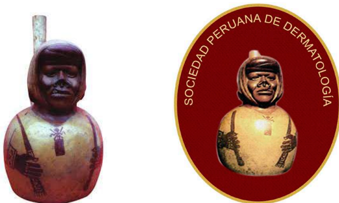
Figura N° 4. Huaco retrato de la cultura Mochica con "uta", logo de la Sociedad Peruana de Dermatología.