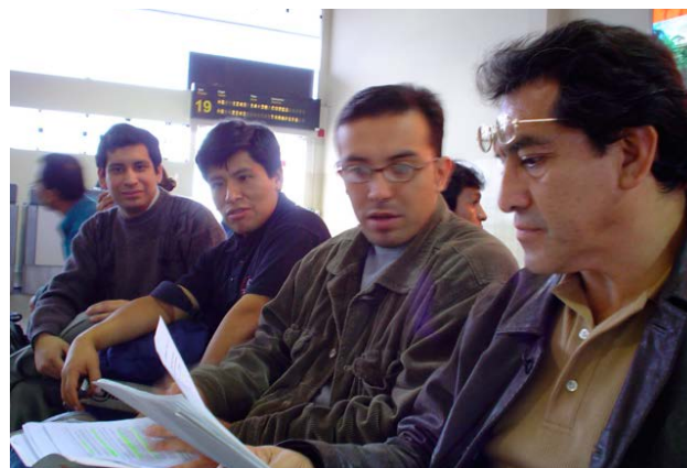
Figura 4. Con sus alumnos, en el aeropuerto, revisando los materiales para la campaña de salud en Chachapoyas.

de investigación conformado en aquellos años por sus médicos residentes y alumnos de pregrado. Con dicho equipo recorrió los departamentos de Ucayali, Huánuco, Junín, San Martín y Amazonas, realizando búsqueda activa de casos así como el tratamiento de los pacientes con financiamiento de los Fondos de Extensión Universitaria (FEDU) los cuales fueron ganados por concurso con otros docentes y grupos de investigación de la Facultad de Medicina. Contribuyeron a este trabajo la colaboración con el Departamento de Dermatología de la Universidad de Miami así como con el Laboratorio de Investigación Dermatológica de la Universidad de Carolina del Norte de Chapel Hill, ambas de los Estados Unidos de América.