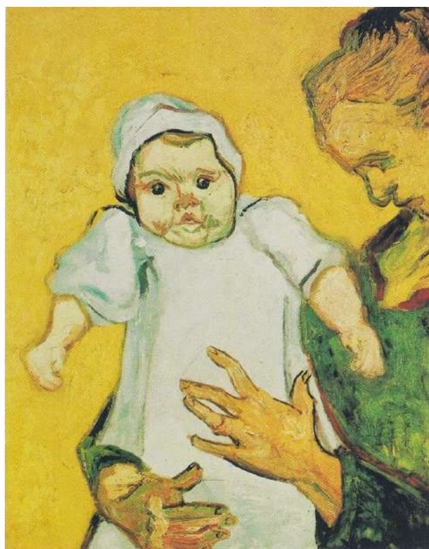
Figura N° 4 B. Mayor resolución de la niña Marcelle