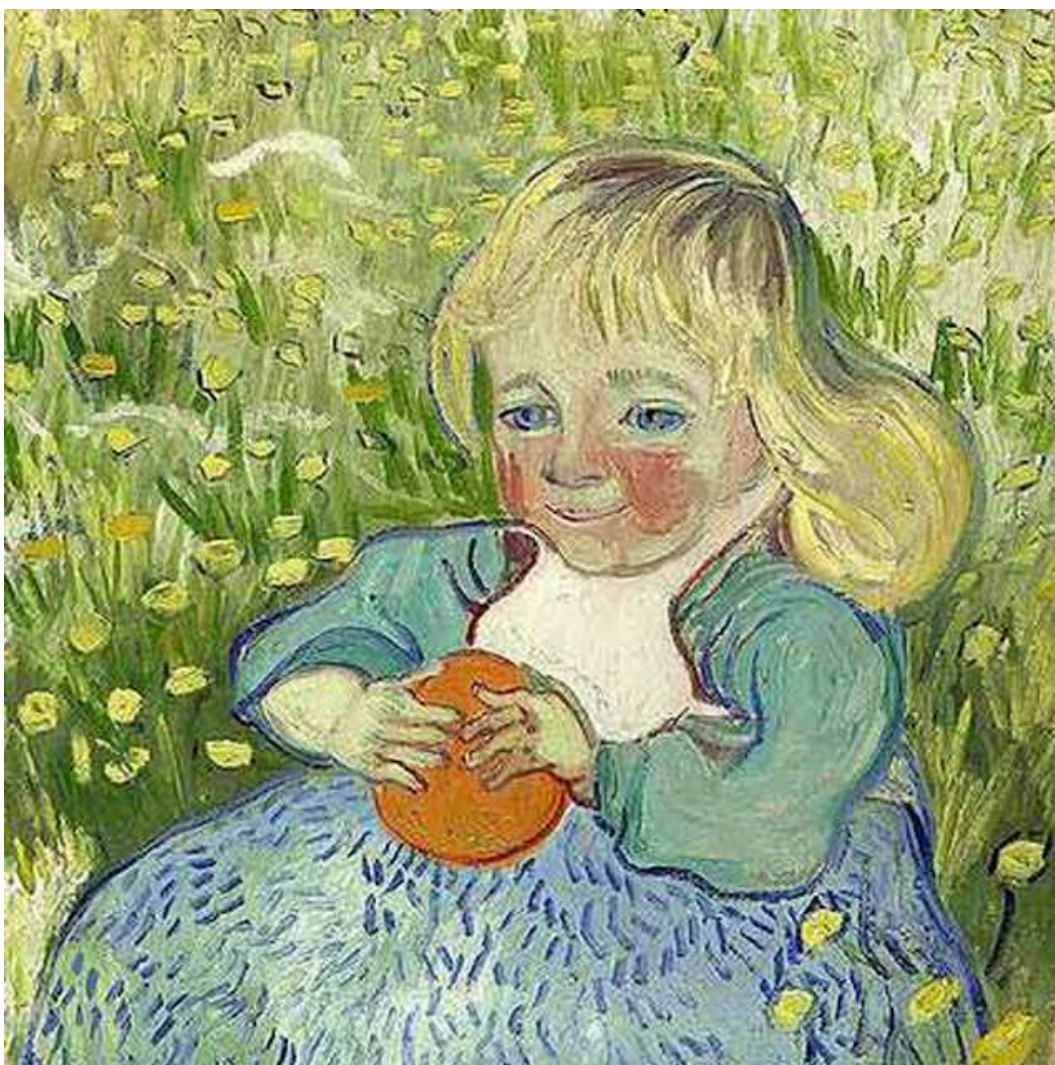
Figura N° 3. El niño de la Naranja (1890). Pintura al Óleo sobre lienzo 6,7. Tamaño 50 x 51 cm.

Colección particular de coleccionista de Suiza