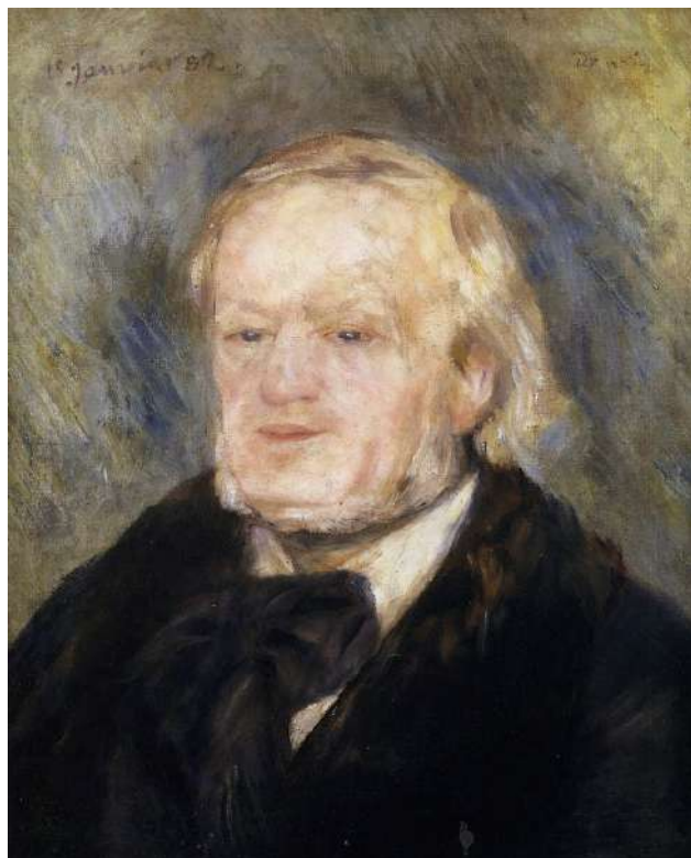
Figura N° 5. Retrato de Richard Wagner (1882). Oleo sobre lienzo 53 x 46 cm.