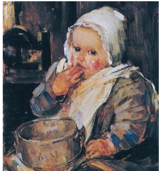
Figura N° 1. Pintura: La escudilla de papá. Colección particular.