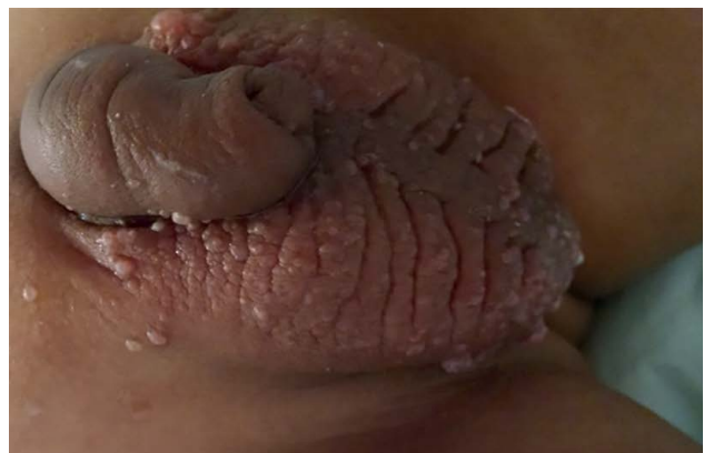
Figura 2. Pseudovesículas (linfangiectasias) sobre piel escrotal y en pene.