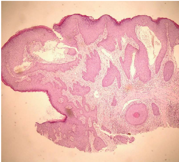
Figura 4a. Capilares linfáticos ectásicos con epidermis suprayacente adelgazada y aumento de las crestas epidérmicas. (HE 40X)